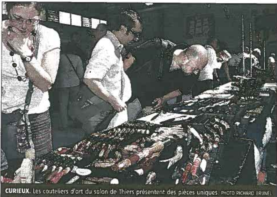
CURIEUX. Les couteliers d'art du salon de Thiers présentent des pièces uniques.

Il faut dire que les pièces uniques que présentent